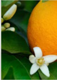
Gorzka pomarańcza Odprężenie